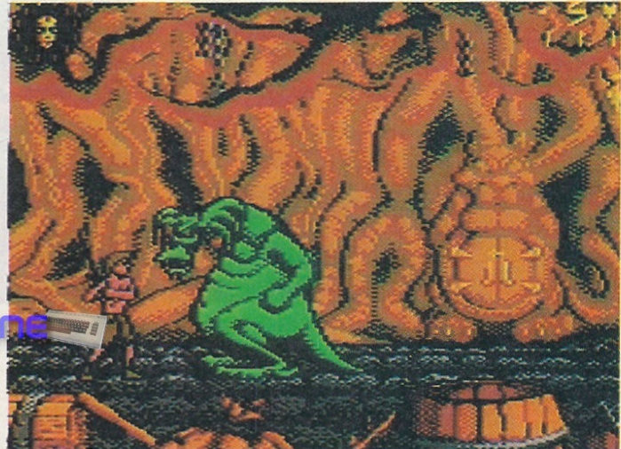
Ebenso lustig wie hinterlistig ist der Drache im dritten Level