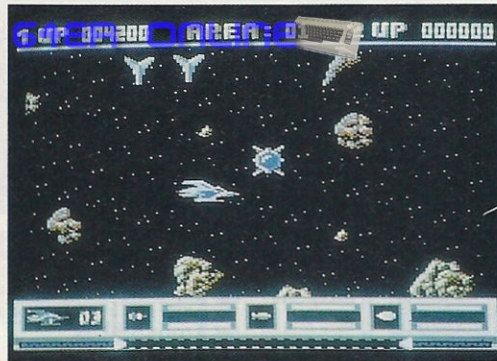
Gutes Teamspiel macht bei Katakis am meisten Spaß. Sie haben einiges zu knacken.

Auf den ersten Blick wirkt Katakis wie eine gute Kopie des Ballerspiels »IO«. Tatsächlich ist